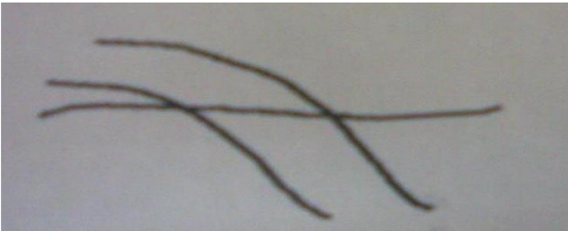
Slika 2: Zakon zajedničke sudbine.

c) Zakon zajedničke sudbine – elementi koji se prostiru u istom pravcu i vremenu imaju tendenciju da se opažaju zajedno.