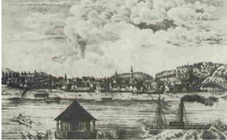
Panorama Zemuna, XVIII vek