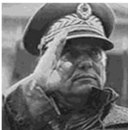
JOSIP BROZ TITO