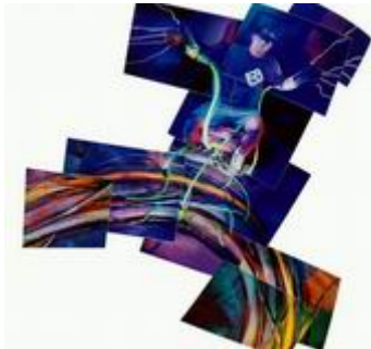
Slika 1. Virtualne organizacije

Virtualna tvrtka predstavlja novi organizacijski model koji koristi tehnologiju da bi se dinamički vezali ljudi, sredstva i ideje. Virtualna tvrtka zapravo predstavlja mrežu tvrtki koje dijele mogućnosti te rizike proizvoda i usluga pa tako prilagodljivost virtualne organizacije nema granica. Kažemo da je to “kao da svaki dan okupimo all-star tim u svrhu savladavanja današnjeg cilja i zadatka”. Virtualno poduzeće je mreža odnosa organizirana na kraće ili dulje razdoblje, koja obuhvaća niz tvrtki koje inače djeluju samostalno, ali u okviru projekta djeluju kao jedinstveno, usklađeno i koordinirano poduzeće koje posluje po principu: “u pravo vrijeme na pravom mjestu”