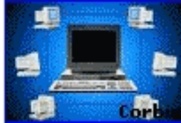
Slika 1. Povezanost kompjutera diljem svijeta

Danas za razvitak svih znanstvenih, tehničkih, stručnih, umjetničkih, humanističkih, komercijalnih i svih drugih područja potrebna je nova pismenost, koja nas uvodi u drugačiji svijet od onoga u kojemu postojimo fizički. To je svijet World Wide Weba (WWW).