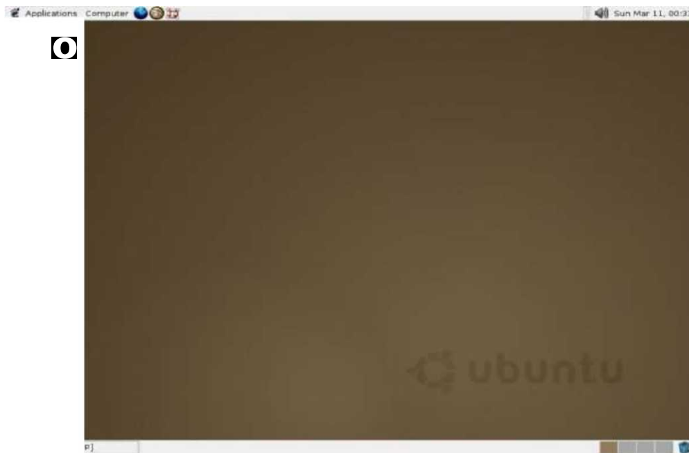
Слика 4. Работна површина на првата верзија, UBUNTU 4.10

Така ознаката 4.10 значи дека изданието од Октомври 2004 година, со кодирано име Warty Warthog (брадавичавото диво прасе).