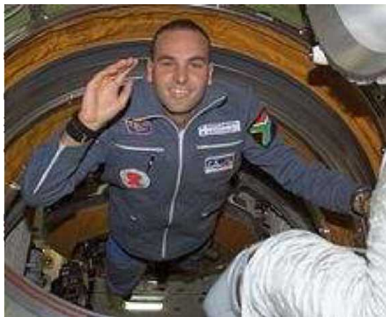
Слика 2. Марк Шатлворт во вселенска мисија

Поради тоа, во 2002 година Шатлворт решил да донира околу 20 милиони американски долари за учество во Вселенска мисија на Руската Вселенска Програма. Во мисијата тој поминал 2 дена во ракетата Сојуз и 8 дена во Меѓународната вселенска станица, каде што учествувал со експерименти поврзани со сидата и истражувањата на генетските материјали.